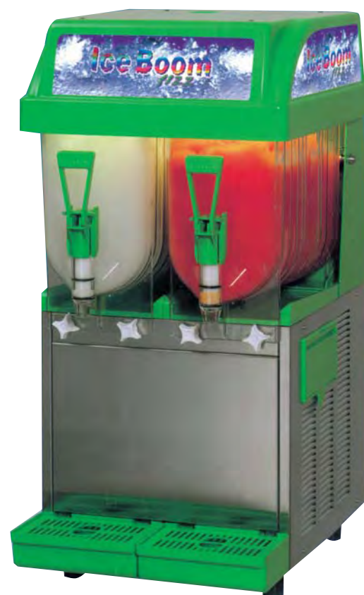
■ ICE BOOM 8.1.1