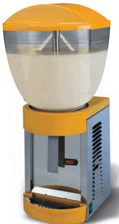
■ DISPENSADOR FRESH-20