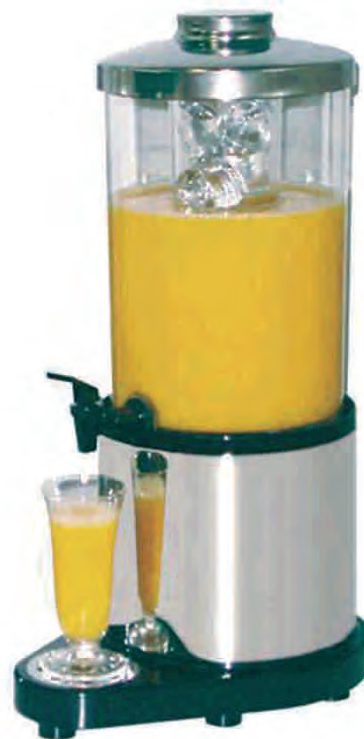
■ MINI DISPENSER