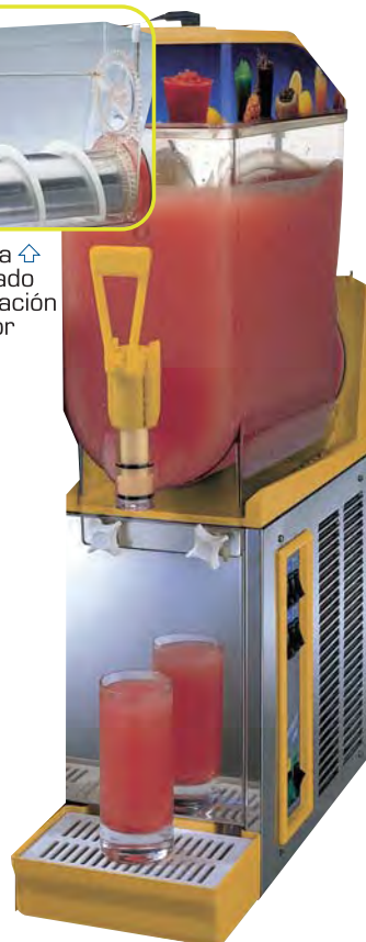
■ ICE DREAM 14 x 1