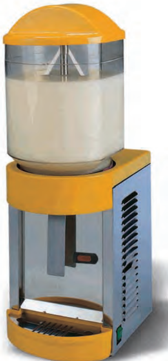
■ DISPENSADOR FRESH-14 NEW