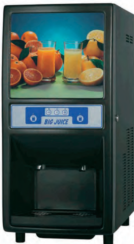
■ BIG JUICE