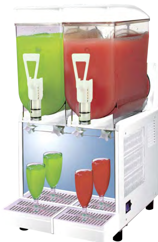
■ SORBY DREAM 10 x 2