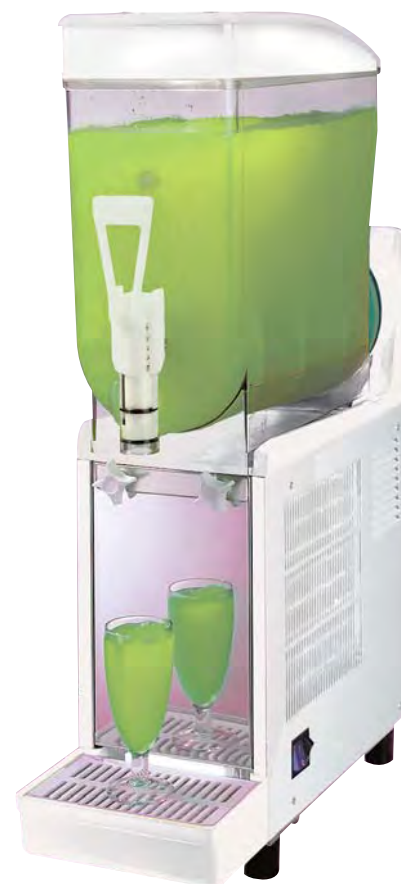
■ SORBY DREAM 10