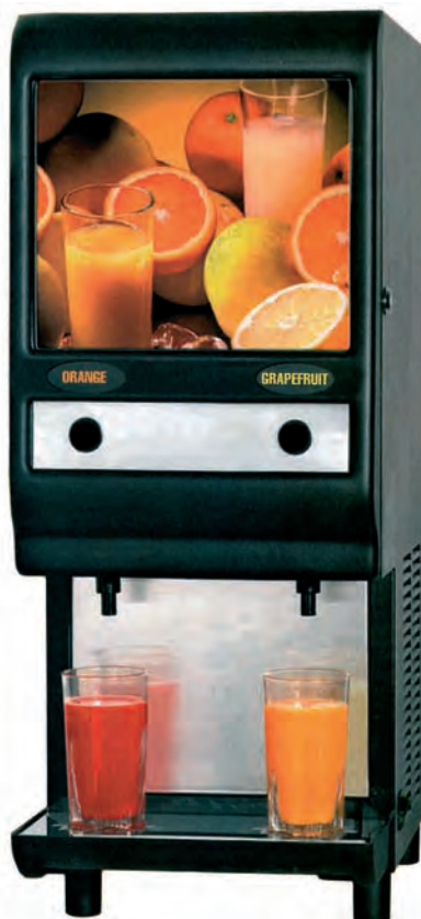
■ FRESH JUICE