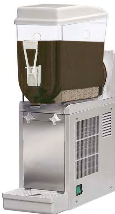
■ SORBY COFFEE 10