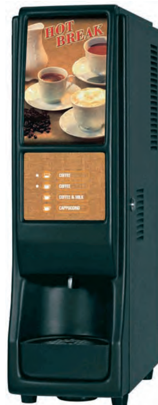
■ HOT BREAK