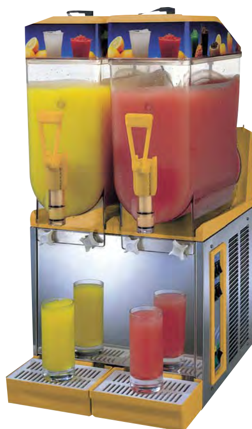
■ ICE DREAM 14 x 2 PROFESIONAL