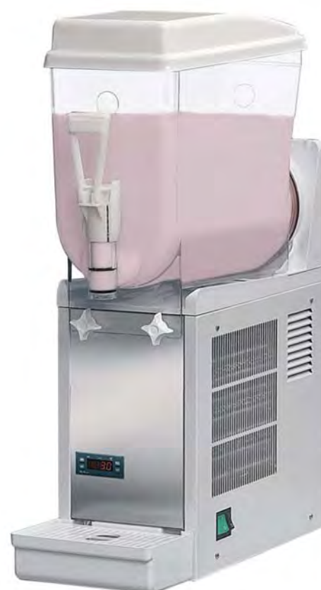
■ YOGURT - 6